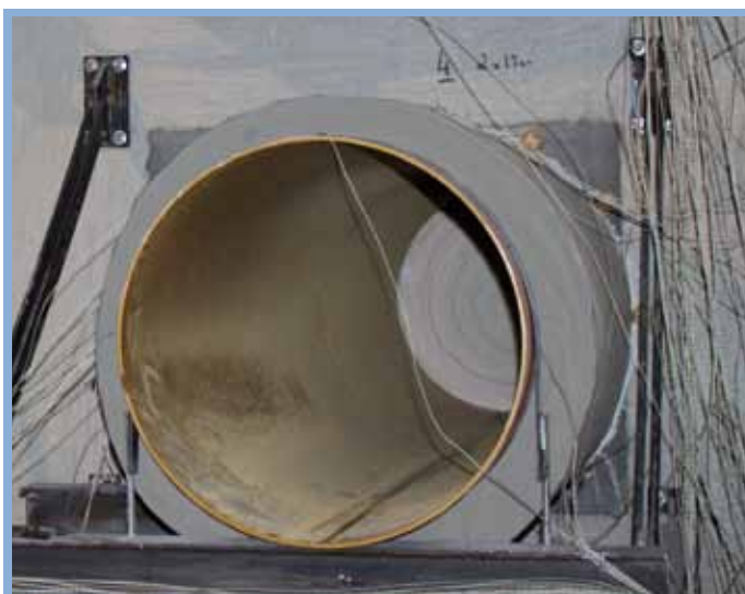
Test au laboratoire Efectis : DN600, EI 240