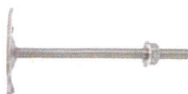
WD/P 6 - Fixation de radiateurs