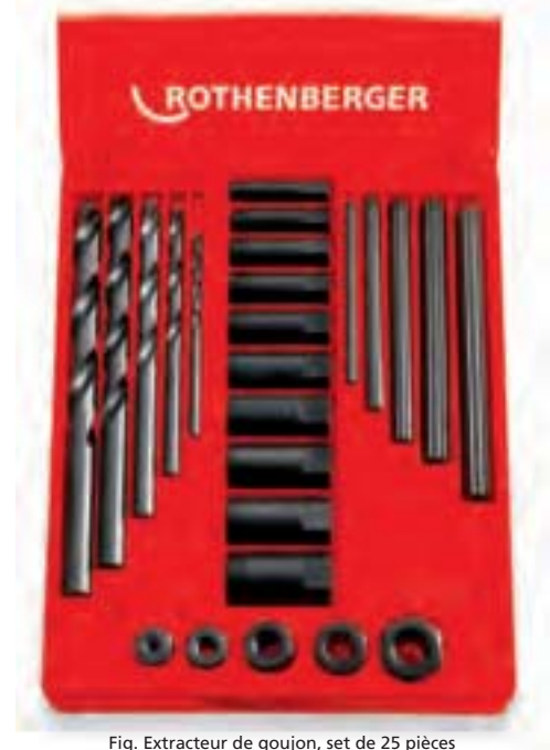
Fig. Extracteur de goujon, set de 25 pièces