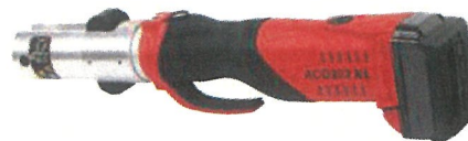
ACO 202 XL