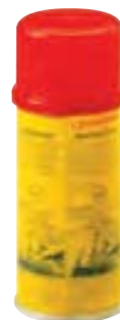
Fig. Spray de cintrage